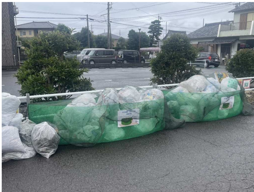
固定式 2.5m-8 2基設置

ごみサークルを設置後の集積所 横からの侵入経路を遮断！車道との区画を管理する事で安全に通行できます。